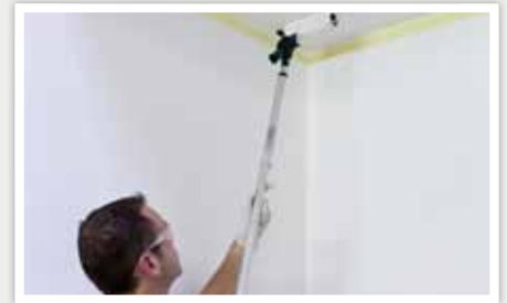
2 A l'aide d'une perche télescopique déposer la peinture sur le plafond.

Appliquer de la peinture dans les angles ou sur les bords pour bien délimiter la surface à peindre à l'aide d'un pinceau rond pointu. Si nécessaire, utiliser un adhésif de masquage.