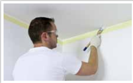
1 Rechampir* les angles.

Pour peindre un plafond, préférez une peinture mate qui réduit les défauts de relief. Toujours peindre dans le sens de la lumière du jour, c'est à dire à partir ou vers la lumière donnée par la fenêtre.