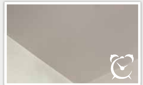
5 Laisser sécher.