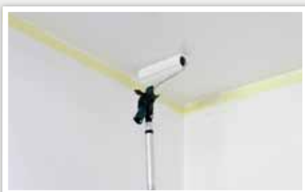
6 Appliquer une seconde couche. Les étapes à suivre sont identiques à la première couche.