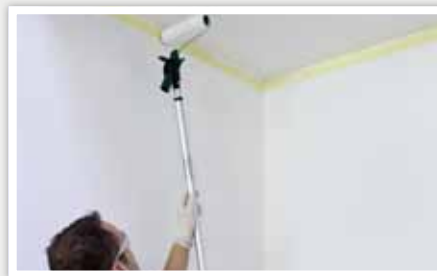
4 Lisser la peinture.