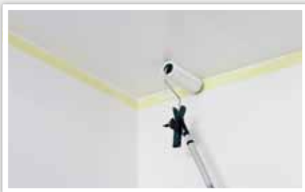
3 Répartir la peinture en croisant les mouvements.